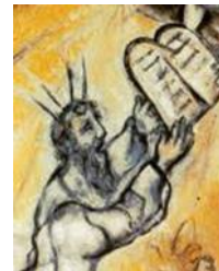
Marc Chagall 1